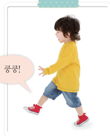
걸을 때 나는 소리