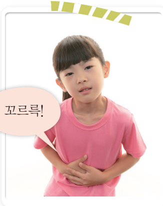
배고플 때 나는 소리