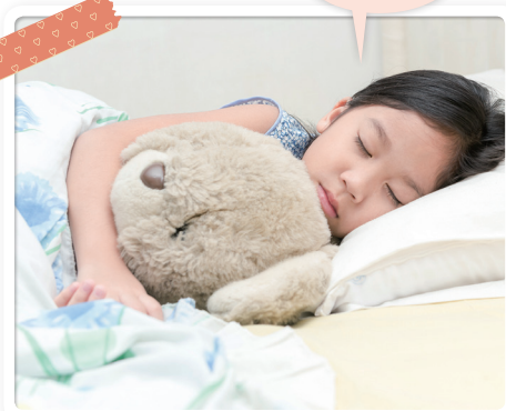
잠잘 때 나는 소리